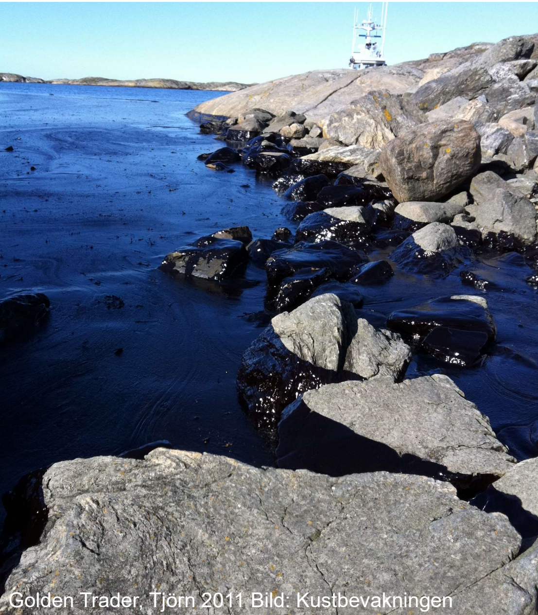
Golden Trader, Tjörn 2011